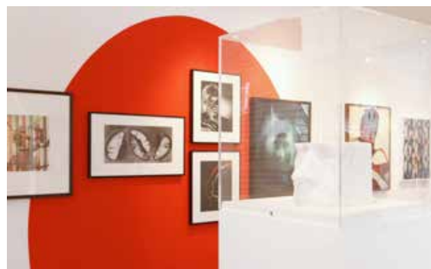
Vitrine sur rue du Centre photographique, exposition Michael Wolf, mars - mai 2016