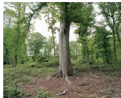
Daniel Quesney Hêtre de la Forêt de Bord-Louvières 2003

Cette exposition conçue à partir de la collection de photographies du Pôle Image Haute-Normandie explore le thème de l'arbre à partir de la série « Les vieux arbres de la Normandie » du savant naturaliste et photographe Henri Gadeau de Kerville (1855-1940). Une sélection de ses photographies reproduites en héliogravure est présentée sous forme d'un dialogue avec des œuvres récentes de photographes contemporains.